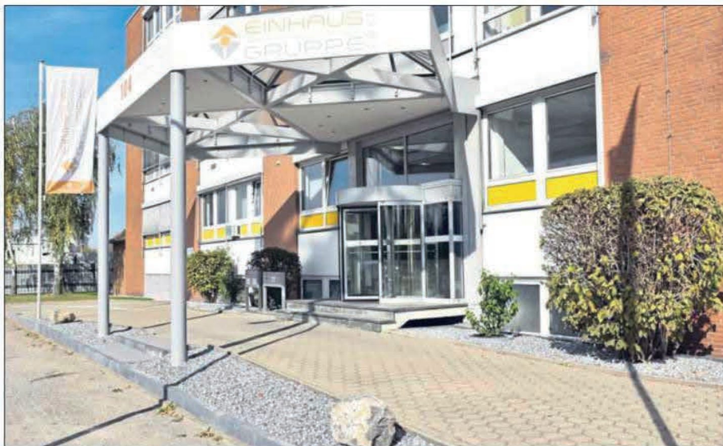
Auch äußerlich hat sich das Haus der Einhaus-Gruppe (früher Maschinenfabrik Scharf) ein wenig verändert – zum Beispiel durch das neue Kiesbeet.